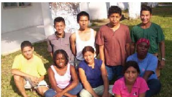
Jóvenes en el Refugio Temporal para Migrantes Menores en la frontera sur de México, inaugurada en Viva México, en abril 2005